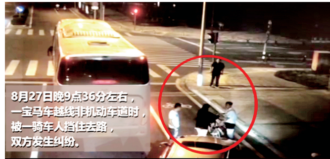
8月27日晚9点36分左右,一宝马车越线非机动车道时,被一骑车人挡住去路,双方发生纠纷。

本案可以参考于欢案件,但是本案中的凶器系被害人自己拿出,并且有伤害骑车人的意图。所以,应该要比于欢案判得更轻。看法院最终能否适用缓刑。南都