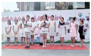
现在口若悬河;从最初的敷衍,到现在的认真,每一点变化,都是青少年成长的足迹。 记者 鲁慧 通讯员 李佳云 文/图

在社工和主持老师的带领下,这7节来,青少年的成长有目共睹,每一段主持词,都是青少年的成长见证。从最初的不敢站出来展示自己,到现在主动报名要上台展示;从最初的沉默以对,到