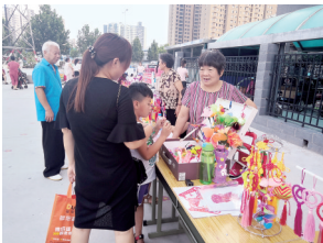
织丝网花,不一会儿,师徒作品便完美地呈现在大家眼前。 记者 鲁慧 通讯员 张素勤 谷阳 文/图

会组织联合会及金水区玖久社会工作服务中心组织的以“传承非遗进社区,指尖文化永铭记”为主题的第二场文化展活动,活动内容照例是非遗文化作品展、非遗文化介绍及非遗文化制作体验三大板块。这支来自江韵芳团队的15位老师编织的物品琳琅满目,精妙绝伦,引来居民驻足观望,甚至有的居民当场拜师求艺,耐心地跟着老师一起编