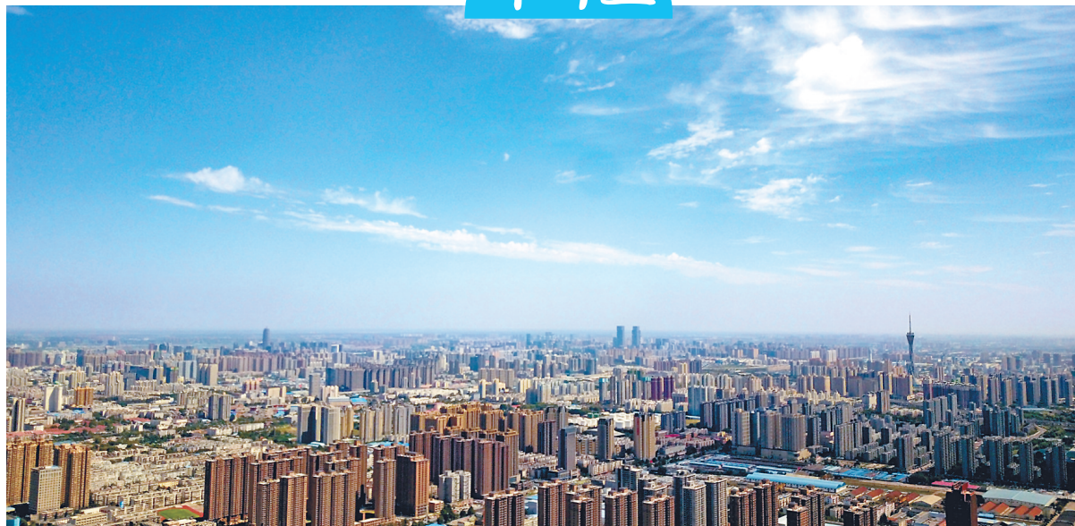
昨日,郑州新地标“三件套”