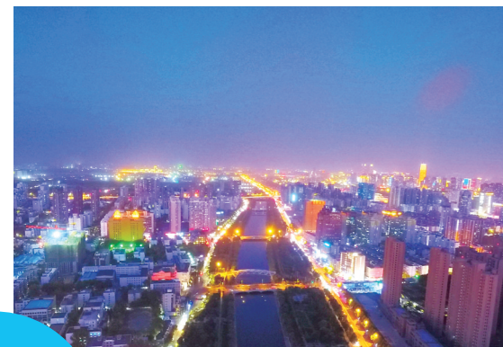
昨日华灯初上的东风渠