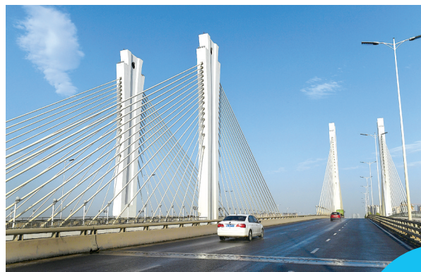
昨日,北三环龙湖引渠桥上空蔚蓝