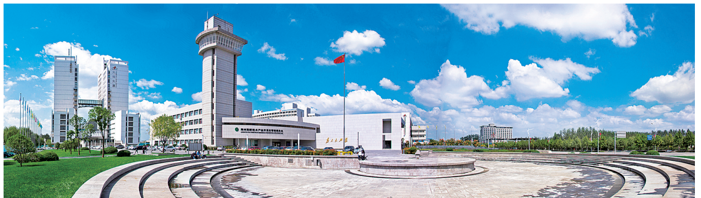
《我们的蓝天》管委广场前 白冀

这些摄影作品集中涵盖了30年来区域发展、历史变迁、开发建设、人文景观等内容。通过摄影者的视角,用镜头语言记录高新区的景与物、人与事,展现郑州高新区建设发展新风貌,以小见大,定格美好生活瞬间,刻录真情实感世界,充分反映对魅力高新区的热爱。摄影图片从记忆高新、人文高新、科技高新、建设高新、今日高新等多方位、全角度展示了高新区30年来的建设发展难忘历程和丰硕成果。 记者 孙庆辉 高新时报 方宝岭