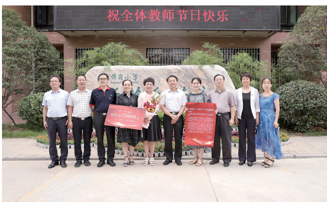
市人大常委会主任许广佑带队慰问佛岗小学