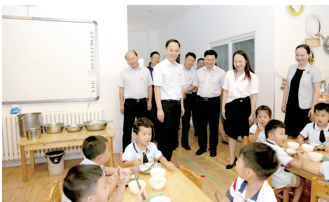
区委书记陈红民看望区第一幼儿园学生

二七区举行2018年教师节颁奖典礼 办好人民满意教育 建设全国区域性优质教育中心