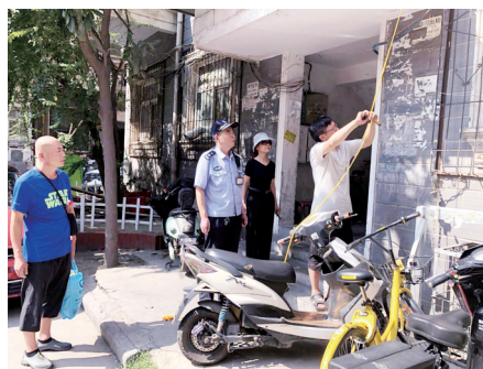
实行“零容忍”。

本报讯 近日,西大街街道开展多种形式的消防安全宣传活动。街道工作人员立足实际,以面对面的形式向居民群众发放夏季消防安全知识、电动车安全提示等宣传册,并现场宣讲消防安全知识和安全常识。深入开展消防安全排查整治活动,联合消防大队、派出所等部门联合行动,对辖区学校、宾馆、饭店等人员密集场所和建筑施工工地、物流和出租屋开展隐患排查。对排查出的隐患要求立即进行整改;不能立即整改的,下达整改通知书,要求在规定时间内整改完毕,如在规定时间内不能整改完毕的,督促停业整改,对各类火灾隐患