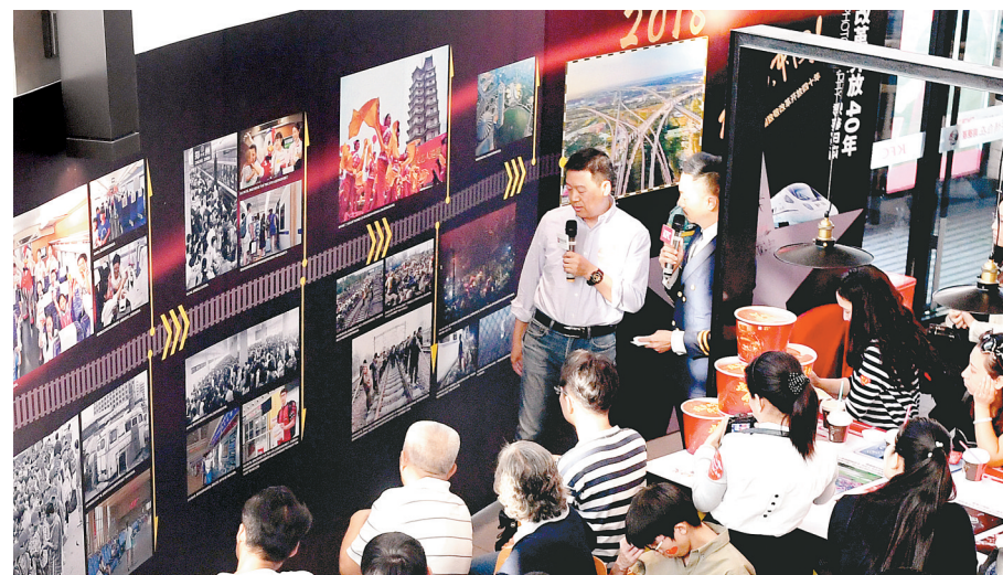
每一张图片的背后,都有一个铁路发展的故事

从进入中国市场时的第一家门店,到目前遍布全国各省的5600多家门店,肯德基伴随各地消费者一同经历了改革开放给人民生活带来的喜人改变。在本次全国范围内展开的“改革开放40年”主题活动中,肯德基在发挥创造力的同时,也凭借自身特有的优势,整合资源,联动线上线下,实现了大规模、大覆盖率的一次推广。从1978年到2018年,作为改革开放的亲历者,肯德基将始终坚持“立足中国、融入生活”的原则,并期待与中国人民一起,迎来社会的和谐发展与民族的伟大复兴。