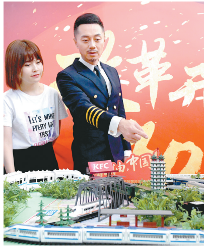
沙盘模型形象地展示了郑州与铁路的关系