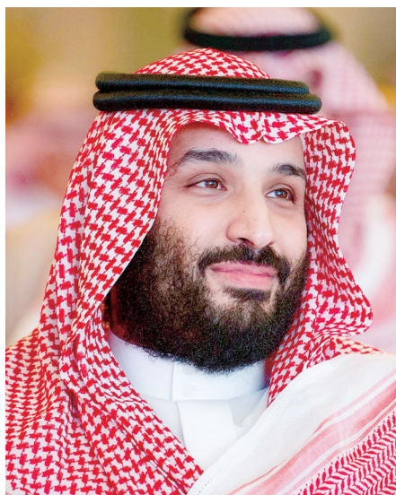
沙特王储穆罕默德

通话后,英国首相府发表声明说,特雷莎·梅在电话中向萨勒曼表示,沙特对于卡舒吉遇害案的解释令人难以信服,还有许多需要通过调查予以澄清的地方。她敦促沙特与土耳其合作,对案件展开透明调查以得出真相。