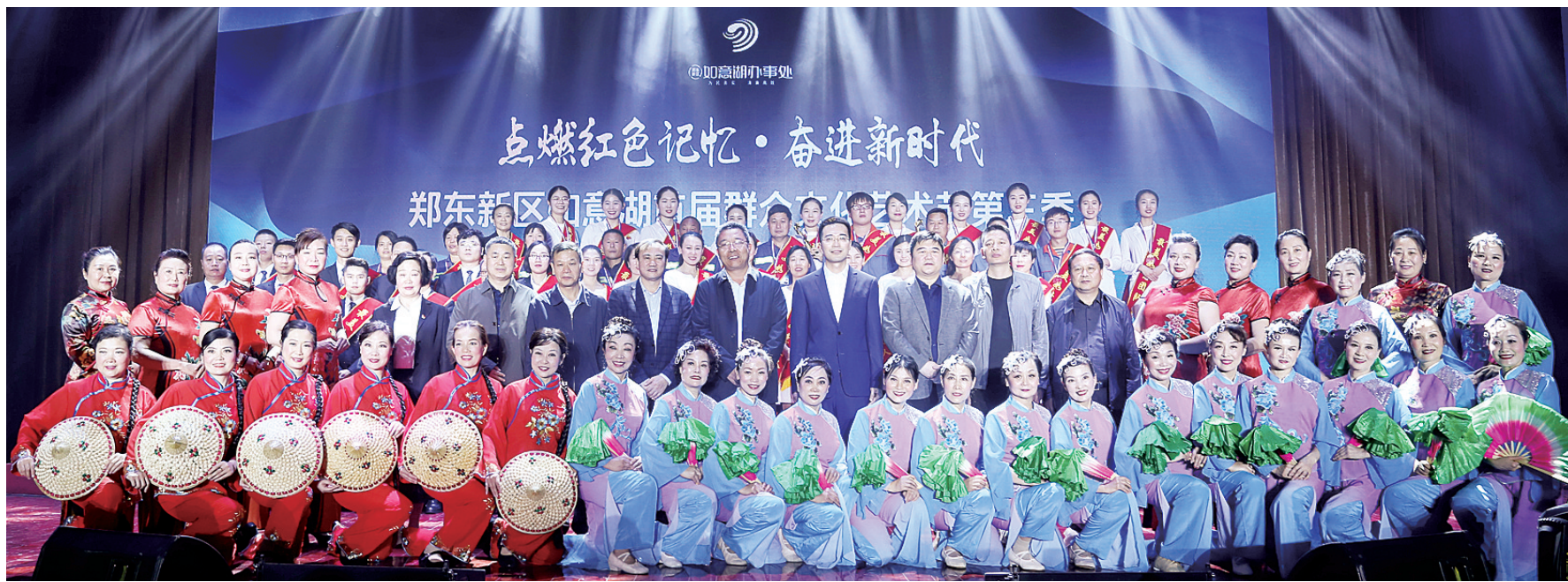
到场领导嘉宾与最美如意团队和参赛队伍合影留念

2018年是中国共产党成立97周年,是贯彻党的十九大精神的开局之年,是改革开放40周年,同时也是决胜全面建成小康社会的关键一年,为深入学习贯彻党的十九大精神和习近平新时代中国特色社会主义思想,弘扬社会主义核心价值观,切实推动文化繁荣,树立文化自信,10月27日,如意湖办事处在颐和医院礼堂举办“点燃红色记忆奋进新时代”首届群众文化艺术节第三季暨最美如意团队颁奖活动,以艺术交流为催化剂,以团队力量为助燃剂,带动辖区企业、居民共同参与如意湖的建设与发展。