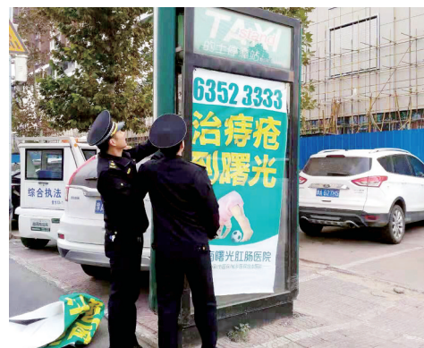
拆除出租车停靠站

本报讯(记者 谷长乐 文/图) 昨日上午,城市管理执法支队出动市政监理所和城管支队执法人员20余名,依法对紫荆山广场周边直饮水机户外广告实施拆除,打响全市道路两侧户外广告整治拆除第一枪。