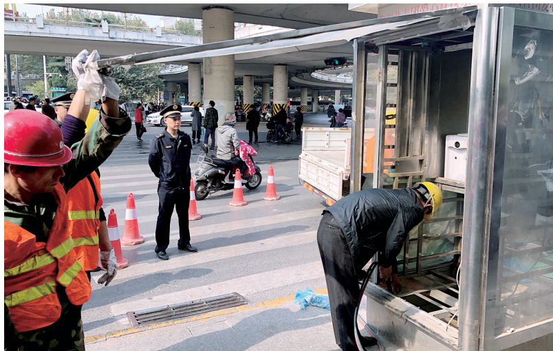
紫荆山立交桥下,一个直饮水站被拆除

昨日上午,郑州市城市管理执法支队在紫荆山周边道路沿线,开展道路两侧户外广告整治行动,重点治理道路两侧直饮水站违法户外广告设施、出租车停靠站违法户外广告设施、灯杆幕旗(灯箱)户外广告、公交站牌和候车亭设置的户外广告、出租车户外广告等问题。