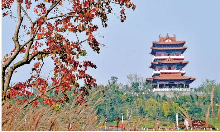
园博园秋韵