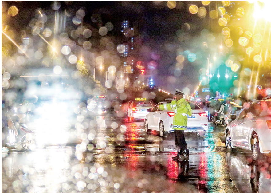
5日傍晚,京广路,一名交警在冷冷的雨中指挥交通。记者 马健 图

今天白天,全省阴天,黄河以南大部分地区有小到中雨,其中西部山区有雨夹雪或小到中雪;其他地区有零星小雨或小雨。明日,全省大部分地区有小雨,其中东部、东南部部分地区有中雨,局部有大雨;西部山区有雨夹雪或中到大雪。8日,全省降水逐渐结束。