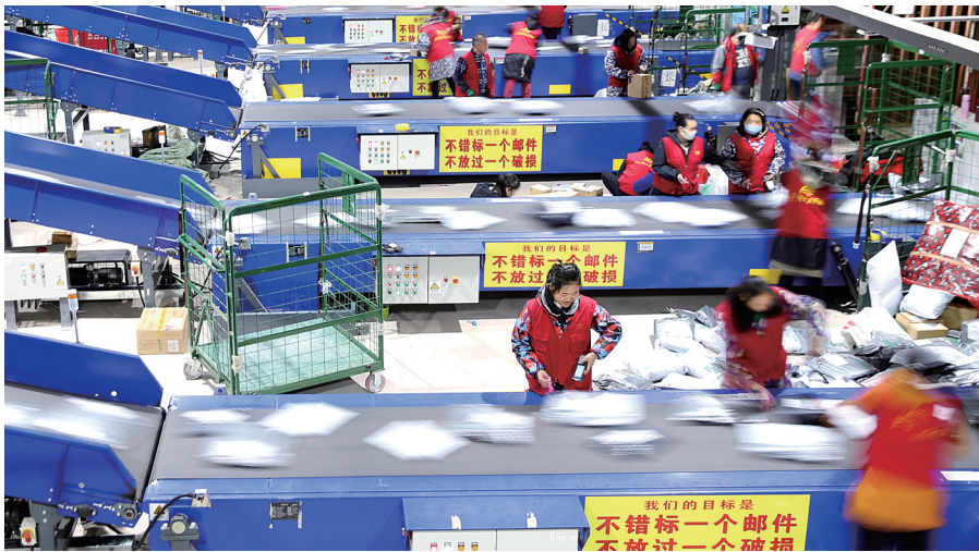
“双11”购物节过后,各地物流企业迎来业务高峰

有意思的是,广东、浙江、江苏三省既卖得多,又送得快,广东省当天签收量排在各省第一、发货也位列第二;发货量最多的浙江省,签收量排在第四;江苏省发货、收货量均位列各省第三。