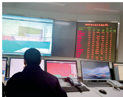
热力调度中心屏幕显示热源全部启动

另外,用户也可以关注郑州热力微信公众号。公众号设置在线服务、客户服务、公共信息三大类,可向用户提供在线交费、户号查询、在线报装、费用查询等多项服务。