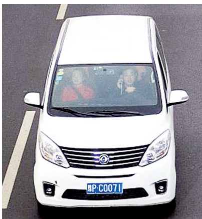
11月1日，白色轿车驾驶员在机场高速打电话被拍，罚200元记2分。

河南区间测速系统不仅抓拍超速违法，还可以抓拍不系安全带、违法变更车道、假牌套牌、开车打电话、大车占道、占用应急车道等其他交通违法；不但能够开展交通安全执法，而且可以依托区间测速系统的智能卡口，分析比对网上逃犯，即时预警，快速堵截。