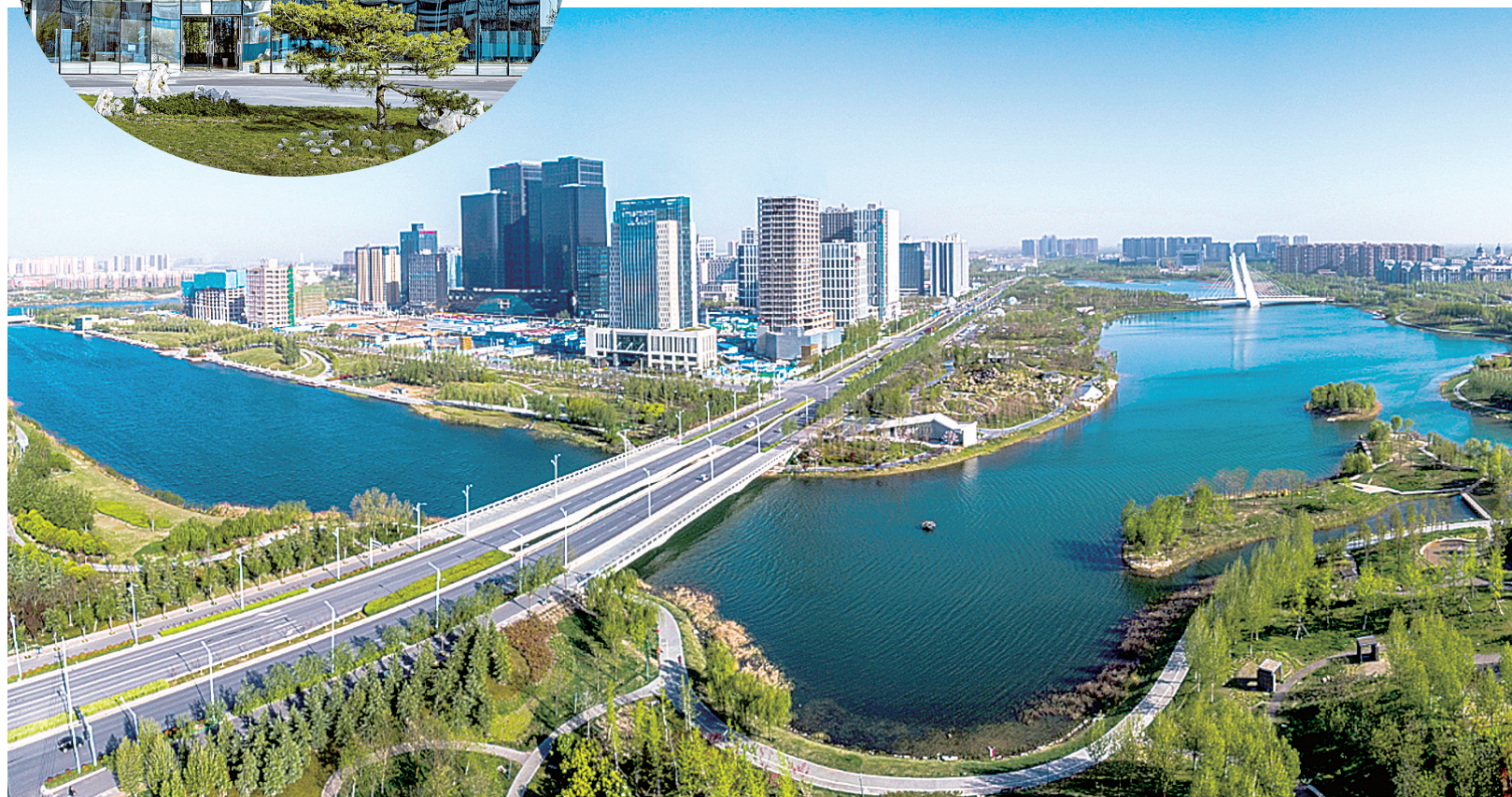
郑东新区龙湖智慧岛

河南省南威信息技术有限公司 等12家大数据项目通过评审 项目涉及车联网、教育等多个方面