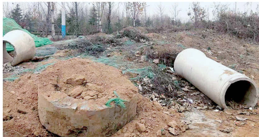
华夏大道的绿化带内杂乱不堪