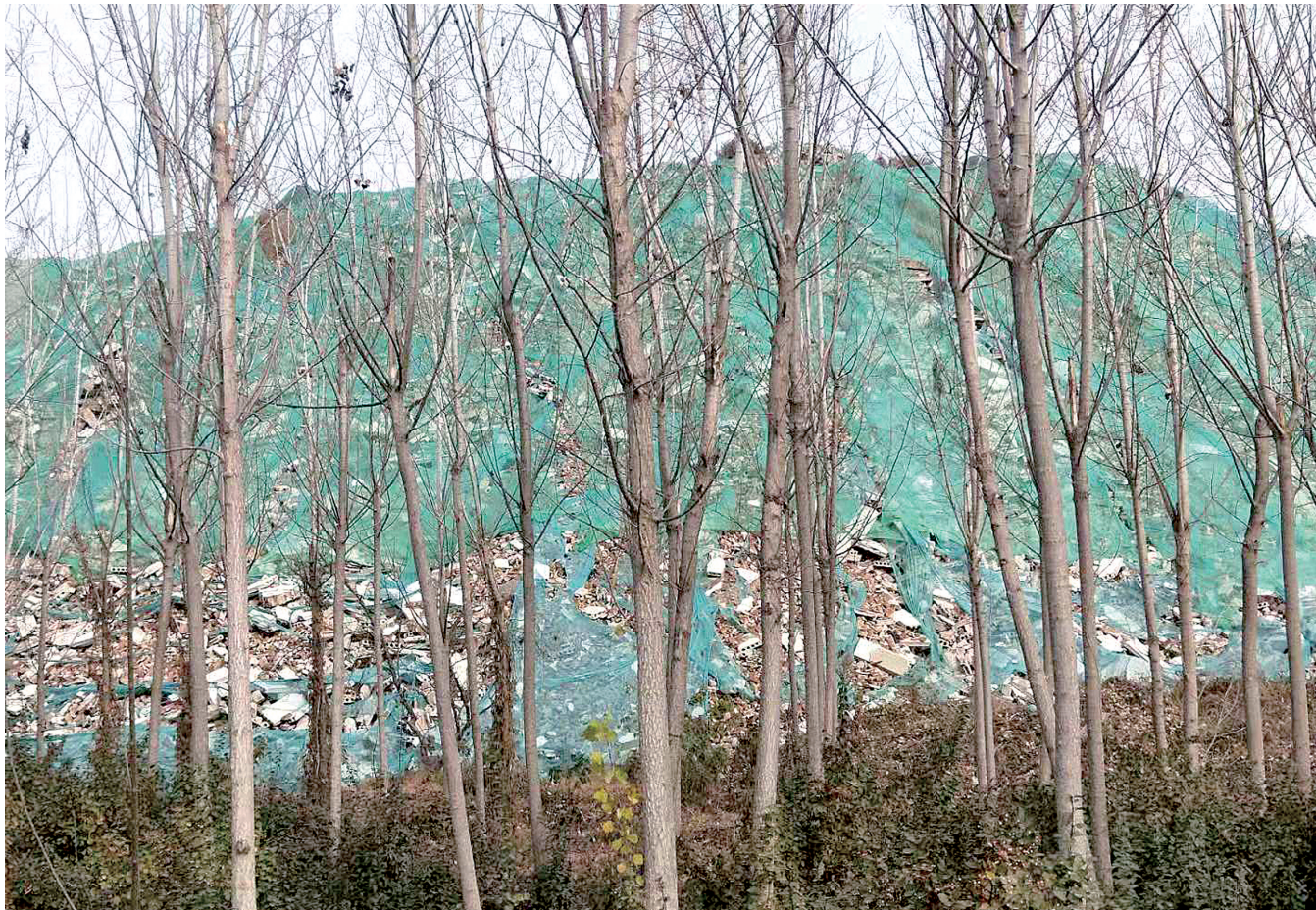
小芦庄桥附近的“青山”上覆盖着破破烂烂的防尘网

可是,昨日上午记者暗访发现,新郑境内的铁路沿线和机场高速沿线的环境不但看不到美,反而是一块块脏乱差的“伤疤”。本报记者