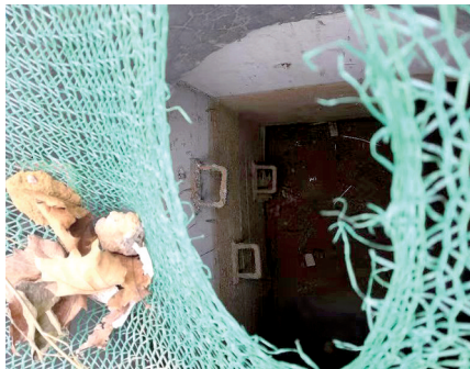
华夏大道“张口”的窨井没有任何防护措施