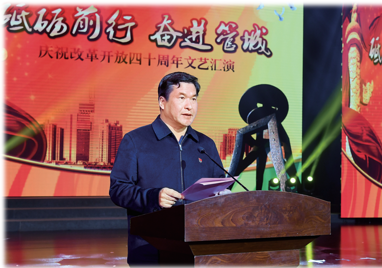
管城回族区委书记虎强出席并致辞