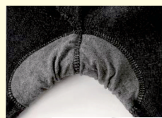
舒适 健康 内裆