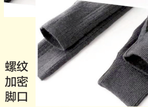
螺纹 加密 脚口