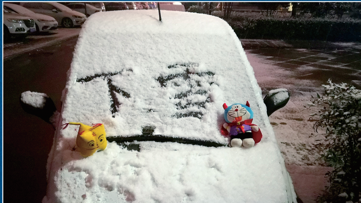
昨晚7点30分,新郑龙湖镇 网友浮雕 图

雪,是静谧纯洁的童话 雪,是洒落心头的回忆 雪,是天涯咫尺的牵挂 雪,是灯火可亲的归途