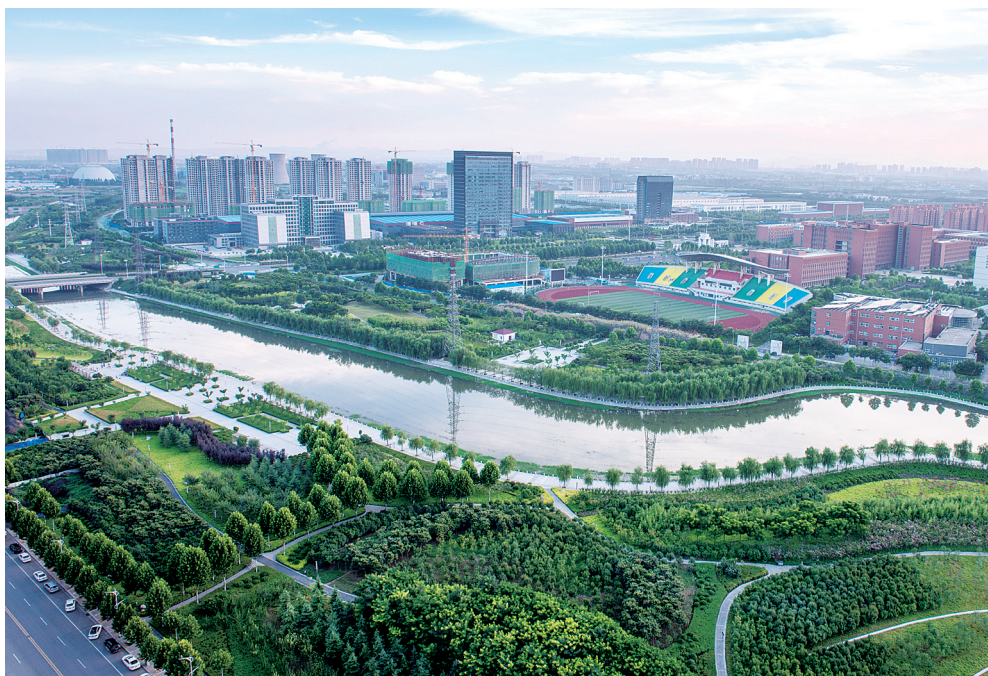
靓景高新区 梁永斌 摄

在不久前召开的中国·河南招才引智创新发展大会上,基于宽带无线网络的车载单元共性技术程翔团队、友文国际创意商业咨询专家友文博士团队等9个领军人才(团队)选择在郑州高新区落地……郑州高新区正以其科技创新高地的优势吸引着越来越多有识之士的目光,着力打造郑州自创区“人才梦之队”。在30年的发展历程中,郑州高新区逐渐形成“创新孵化培育能力强、知识产权工作基础雄厚、企业上市和挂牌工作领先、辖区科技创新资源富集”等四大优势。 郑报融媒记者 黄永东 孙庆辉 实习生 李文娟 梁冉冉 文/图