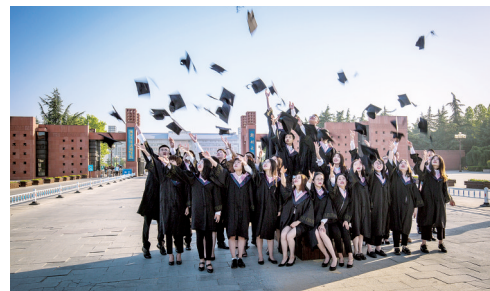
放飞梦想的地方