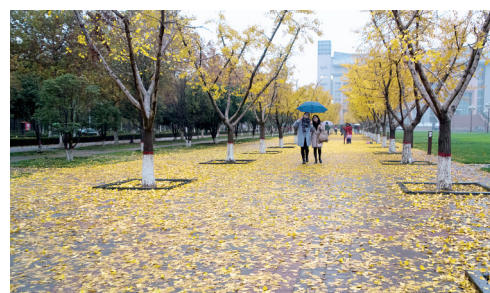
校园秋色