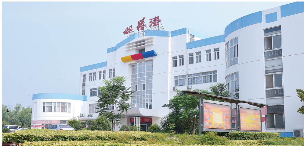
郑州双塔涂料有限公司

该公司前身为郑州油漆厂,始建于1926年,历经90余载风雨始终巍然屹立。20世纪80年代乘改革开放的东风实现了第一次腾飞。2004年底,双塔与国内涂料旗帜企业湖南湘江涂料集团完成战略重组,迅速恢复和发展,重新焕发勃勃生机。今天的“双塔漆”华彩绽放,享誉神州。特别是今年整体经济形势低迷的情况下,双塔涂料增速却高达30%,远超涂料行业平均水平。 记者 徐刚领/文 周甬/图