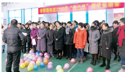
此次运动会丰富了广大职工文化生活,让全体职工以更加饱满的热情投入到新一年的基层建设事业中去。

活动现场热闹非凡,参赛人员精神抖擞、各显神通。在赛场上,大家都充分发挥自身优势和团队精神,奋勇拼搏,默契配合。虽然天气寒冷,但职工们的参赛热情高涨,掌声、欢呼声不绝于耳。