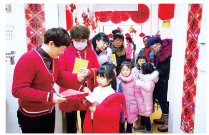
区则有“拓印金猪”“福气满满”“迎春纳福”“剪纸达人”“泥塑小屋”等,玩法各异、生动有趣,让孩子们大显身手、感受传统。 记者 张改华 通讯员 陈慧 文/图

据了解,汝河一幼本次庙会游园活动,开设有游戏区“斗鸡”“跳方格”“打地鼠”“猜灯谜”“滚铁环”等传统游戏,工