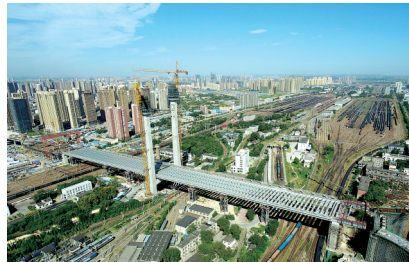
9月7日 京广陇海线的郑北大桥正式合龙