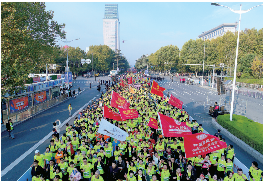
11月3日 首届郑州国际马拉松从郑州中原路开跑