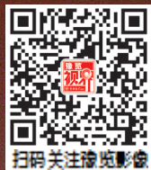
扫码关注豫览影像