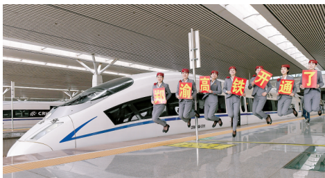
4月10日 郑州东站,列车员在站台上庆祝郑渝高铁开通首发