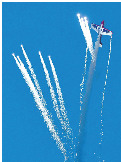
4月27日 上街航展,夜幕中的飞行表演