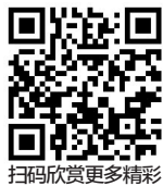
扫码欣赏更多精彩