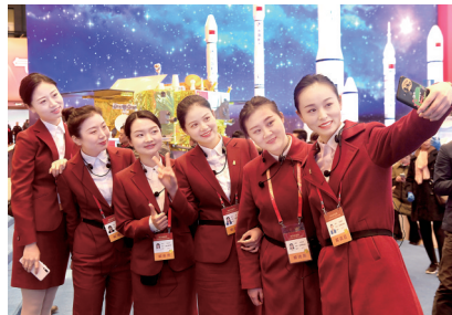
12月11日 北京国家博物馆,来自河南的解说员工作之余拍照留念。