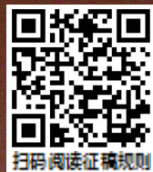
扫码阅读征稿规则