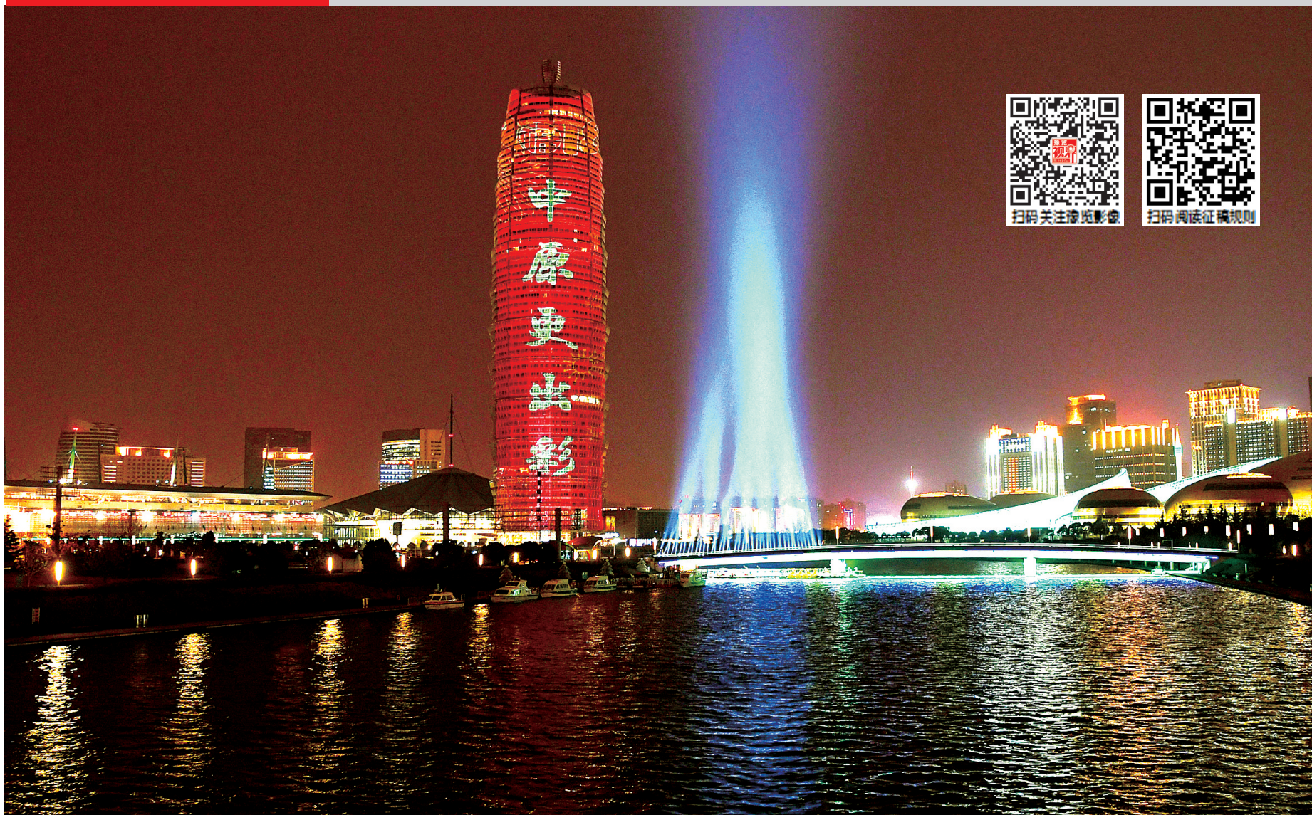
2月16日 央视直播大玉米灯光秀