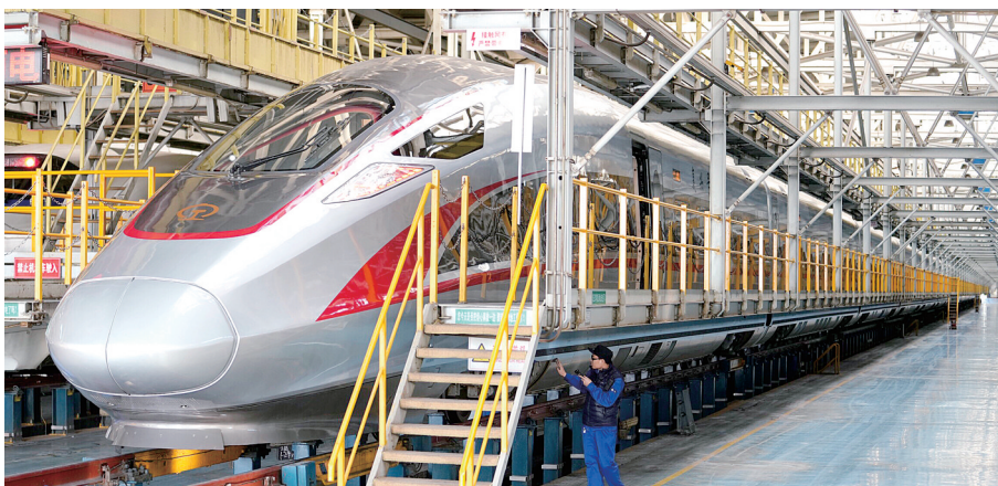
工作人员在中国铁路北京局集团公司北京动车段检测即将上线的动车组

长三角“复兴号”动车组开行不断扩容,扩大开行线路除京沪高铁外,还有沪宁城际、宁杭高铁、合蚌高铁等。