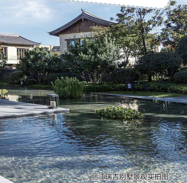
丽江瑞吉别墅景观实拍图

留住青山绿水就是留住美丽乡村 丽江的玉龙雪山就是金山银山 农业时代,财富在农田里; 工业时代,财富在厂房里; 互联网时代,财富在写字楼里; 对于独具慧眼、酷爱运动、渴望放飞、享受度假的人来说,财富就在郑报丽江M酒店里。 因为一次选择,一次投资,你将拥有——丽江天瑞豪生度假区健康养生纯洋房社区70年住宅产权; 享受郑报丽江M酒店70年托管服务; 坐享总房款的30%一次性返还(房屋托管的前5年,每年返总房款的6%,5年一次性返还); 坐享红利分成(后5年,业主与酒店按照酒店经营利润的6:4分成,业主占比六成,酒店占比四成); 业主尊享每年30天的免费入住权(可转让给亲友、朋友同住); 本权利的最终解释权归郑报丽江M酒店。