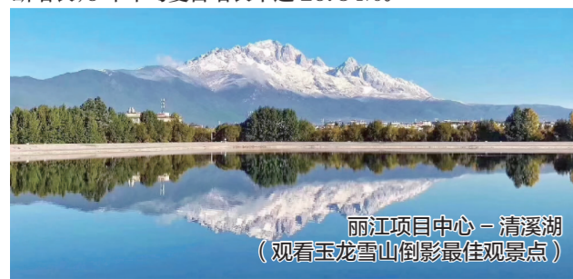
丽江项目中心—清溪湖 (观看玉龙雪山倒影最佳 viewpoint)

2012-2017年,丽江旅游业发展势头良好,旅游人数不断增长,6年年均复合增长率达20.54%。