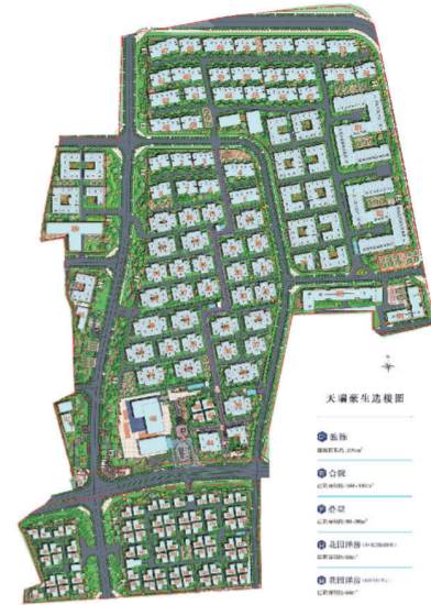
天瑞豪生丽江度假区总平面图