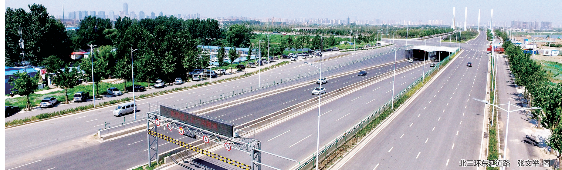
北三环东延道路