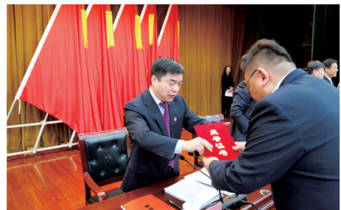
区长苏建设为先进个人颁发荣誉证书