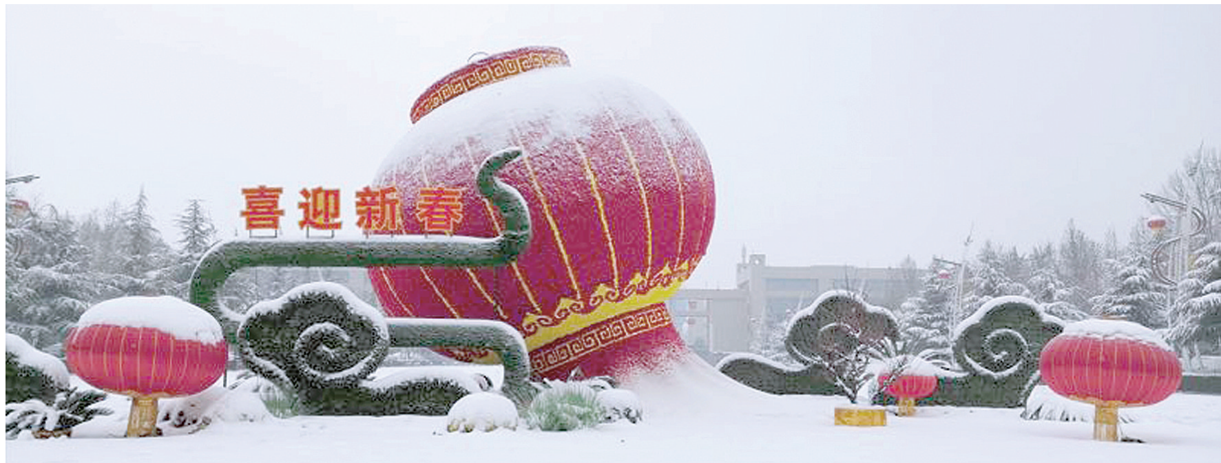
喜迎新春