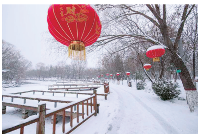
惠济雪景独好