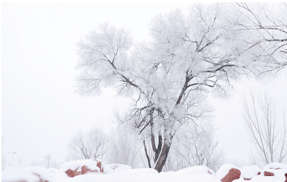
黄河大堤雾凇