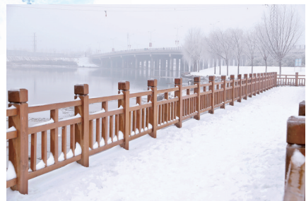
雪景美到不敢相认

在黄河大堤沿线,沿大堤两侧,只见树丫上玉树琼花,柳树、杨树、蒿草等一夜“满头白发”,在雾气掩映中忽隐忽现。南裹头黄河边,不断有市民驾车,邀三五好朋,携家人亲属,停车驻足,拿出手机拍照留念,欣赏这难得的雾凇景观。记者 鲁慧