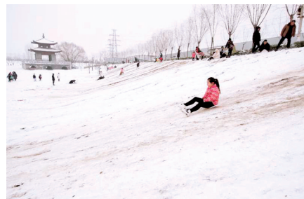
雪趣 曹清林 图