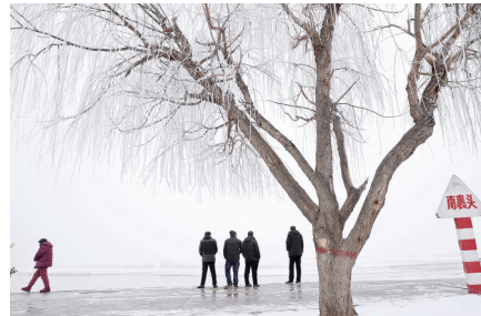
银装素裹 敬春 图