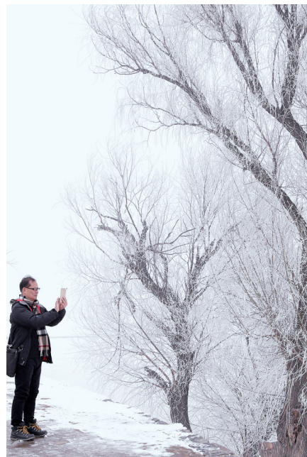
拍照留念 敬春 图