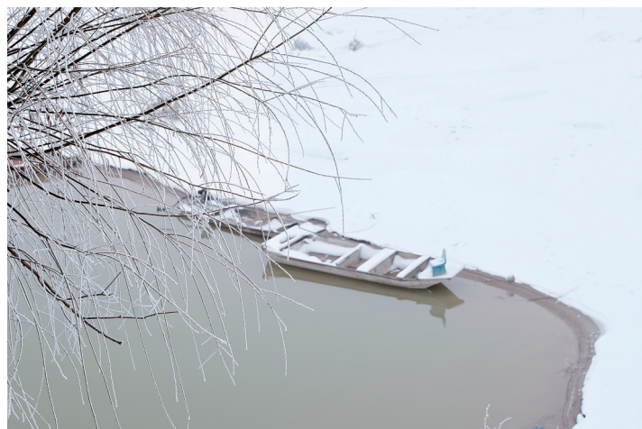
一步一景让你想做诗

岁月变迁让城市几多虚浮,一场白雪把它P回本来的美貌。难怪有人说,一下雪,郑州就变了个样。