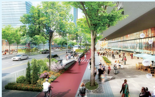
二七商业区综合管廊效果图