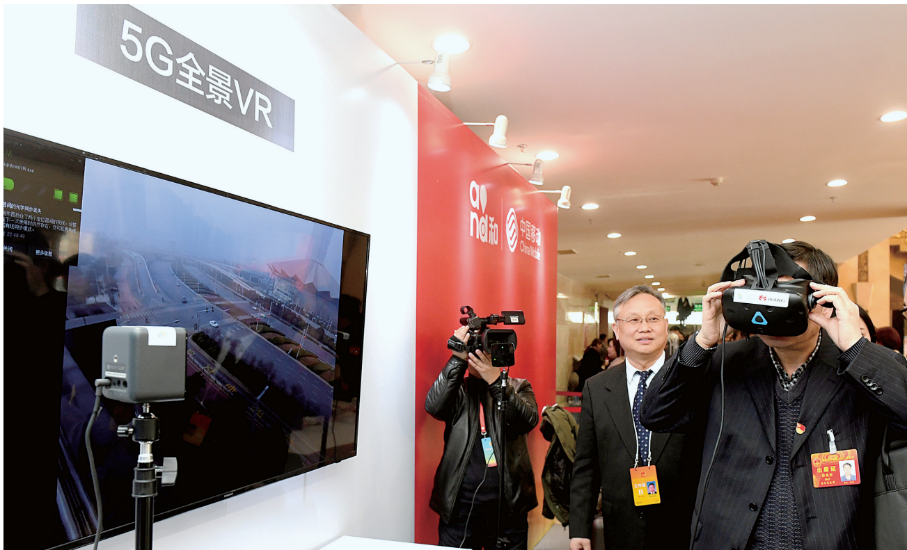
与会人大代表体验5G网络下的实时全景VR