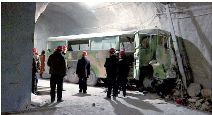
内蒙古锡林郭勒盟西乌珠穆沁旗银漫矿业有限公司井下车辆事故现场

新华社电 记者从24日召开的内蒙古自治区锡林郭勒盟“2·23”重大事故新闻发布会上获悉,内蒙古自治区已成立调查组,着手开展事故调查,将彻查有关方面的责任;对事故中的伤者正在进行全力救治。