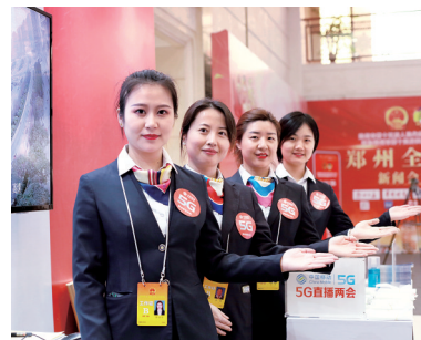
热情的移动工作人员