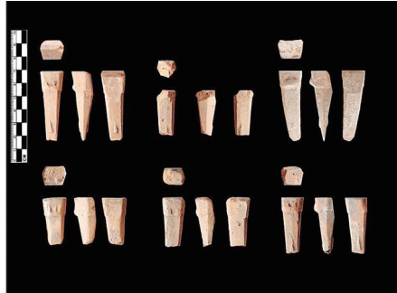
荥阳官庄遗址两周及汉代手工坊遗存空首布币

两周作坊外,还发现了汉代砖瓦窑、铁器窖藏和砖砌窖穴,出土有铁鼎、铁质高柄薰炉、犁铧、铁戟等较完整的铁器。说明此地汉代可能有冶铁作坊。这为研究汉代荥阳地区的手工业生产提供了重要资料。