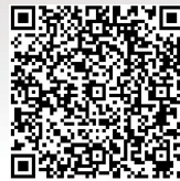
扫码收听第二期“豫先生”播报