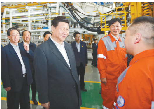
2014年5月10日上午,习近平总书记在中铁工程装备集团有限公司盾构总装车间同现场职工亲切交流(资料图片)