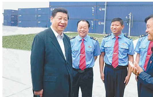
2014年5月10日,习近平总书记考察郑州国际陆港(资料图片)

2014年5月10日,习近平总书记来到郑州国际陆港,寄语河南建成连通境内外、辐射东中西的物流通道枢纽,为丝绸之路经济带建设多作贡献。