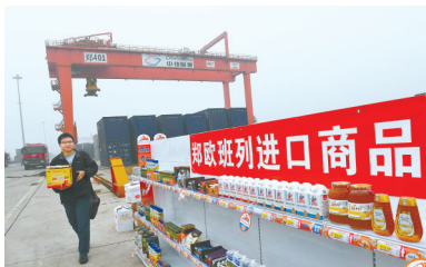
进口商品琳琅满目