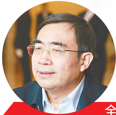
全国政协委员 宋纯鹏

“我们在实践中越来越感觉到,传统产业改造升级和新兴产业培育发展都是实现河南高质量发展的重要举措和砝码。”李涛建议,通过加大资金、技改、研发,以及人才培养的投入,完善基础研究到技术应用的链条,让来之不易的科研成果迅速转化成现实生产力,加快产业转型升级,增强经济发展支撑能力。