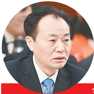
全国人大代表 李涛

“习近平总书记参加河南代表团审议并发表重要讲话,这是总书记对中原大地、对河南亿万人民的牵挂和惦记,我们备受感动。”全国人大代表,河南省工业和信息化厅厅长李涛说。我省始终坚持“三农”工作重中之重地位不动摇,为乡村振兴提供不竭动力。