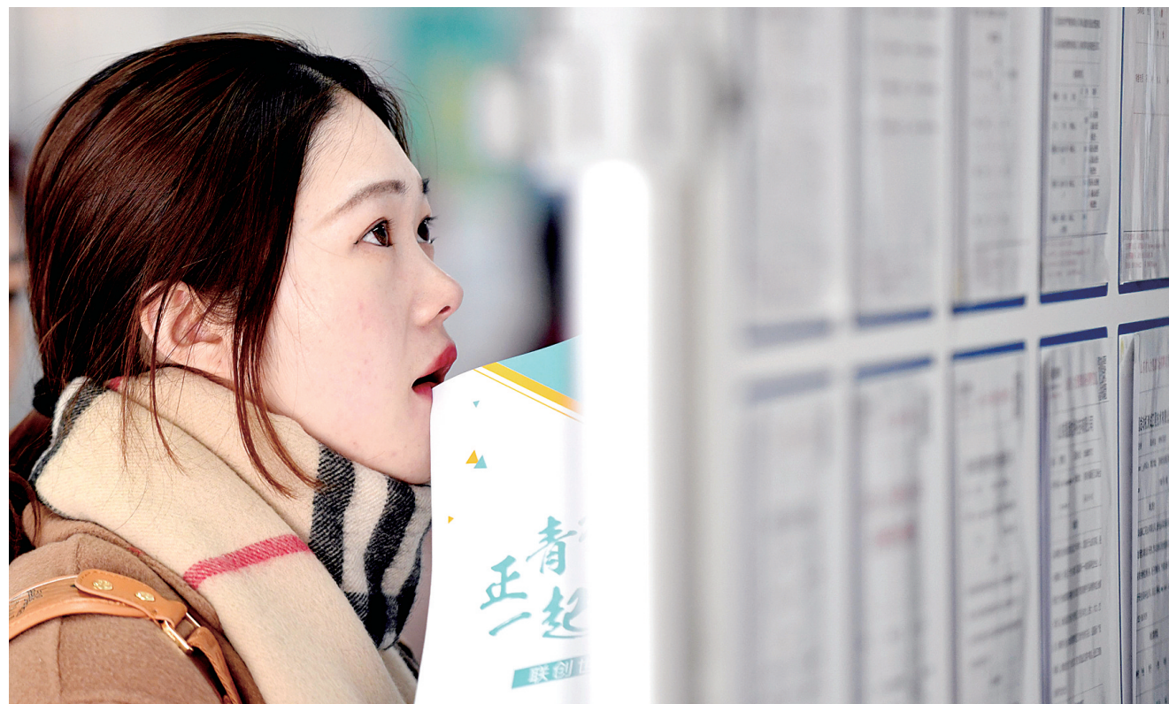
一名求职者在查看招聘信息。新华社发(资料图片)