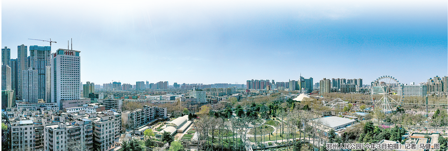
郑州人民公园(今年3月拍摄)

有关的线索32708个,其余为咨询电话或者不在受理范围内线索。截至目前,办理举报案件8629件,共落实环境污染有奖举报累计1422件(500元1082件,1000元32件,5000元11件,10元线索奖297件),共发放奖金630970元。