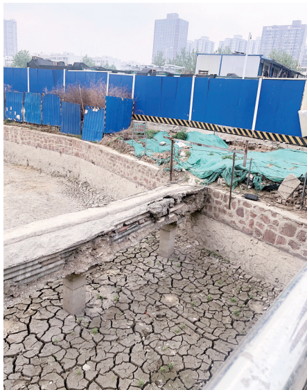
金水河工人路航海路交叉口南

在紫荆山南路办事处辖区紫宸路紫东路口北十八里河,检查人员发现,河道干涸,河床和岸边扔了许多生活垃圾和建筑垃圾,散发着恶臭,行人掩鼻通过。河边一家正在摆放桌椅的夜市烧烤店看到检查人员到来,迅速收摊。这家烧烤店没有污水管,将污水和洗餐具的脏水直接排入河道。此外,河两岸一些商户门前有垃圾,未落实门前“四包”,人行道地砖破损,停放有僵尸车和废弃共享单车。