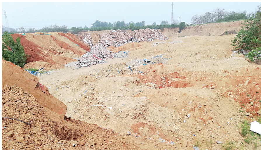
新郑一建筑垃圾消纳场黄土及建筑垃圾裸露约7000平方米

同样是在山后杜村,执法人员对一处无名塑料加工厂的整改情况进行督查,现场生产设备已拆除,原材料清空,取缔到位。