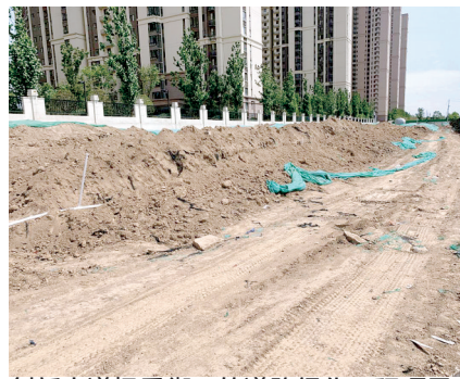
创新大道枫香街口的道路绿化工程项目

下午2时,市联合执法督查组来到位于创新大道与枫香街交叉口东南角的道路绿化工程工地。此处绿化工程无扬尘责任标识牌,无“三员”管理责任牌,无门