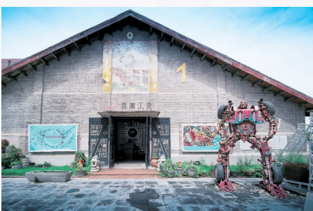
良库工舍