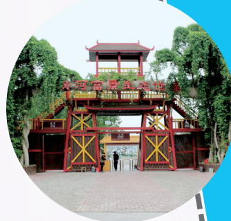
黄河富景生态世界