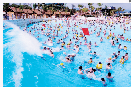
高达三米的“海啸”冲浪