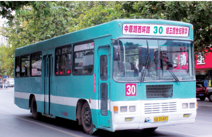
15年前开通时的30路公交,你还记得吗?

本报讯(郑报全媒体记者 张华 通讯员 罗伟华 文/图)昨日起,地铁5号线沿线公交线网开始优化调整,其中撤停B6等12条线路,优化B1等11条线路,新开B301和6条社区接驳巴士,并对25条线路的运行时间进行了延长。调整首日,乘客感受如何?记者进行了实地采访。