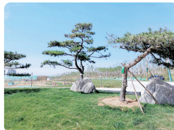
郑西高铁南线廊道美景如画