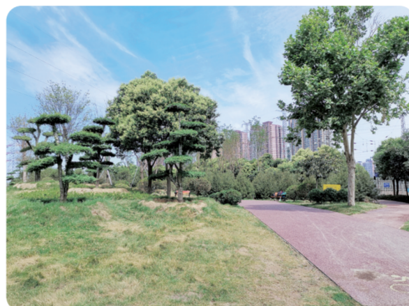
电厂路游园环境幽静,树木浓密