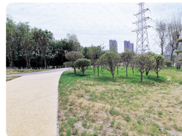
电厂路游园绿植茂盛生长

三步一小景,五步一花丛。走在中原区,如今能明显地感受到人居环境的提升。加上蓝天白云的衬托,许多市民都说,拿起手机随手一拍都是一幅优美的风景画,心情也随之愉悦了许多。这些改变离不开路长制市容市貌大提升工作的具体落实,更离不开全区生态建设的扎实推进。