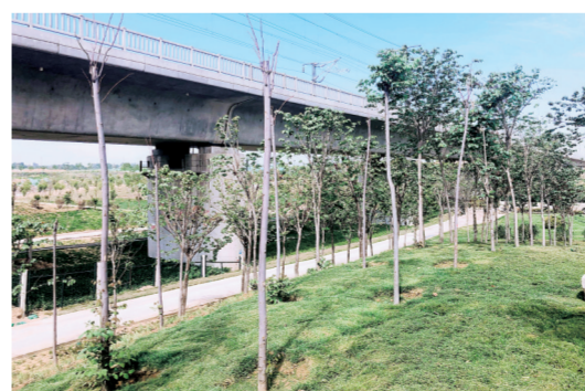
郑西高铁南线周边绿油油的游园

涉及中原区的铁路为陇海铁路、郑西高铁南线、郑西高铁北线三条铁路,全长24.3公里,存在违法建筑92处、有证建筑72处,共计13.95万平方米已全部拆除,清运垃圾27.63万立方米,培土216.36万立方米,所有涉及区域均按照市定节点移交并进行了绿化施工。截至目前,新增绿化面积约106万平方米。