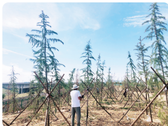
南水北调体育公园养护新栽绿化苗木