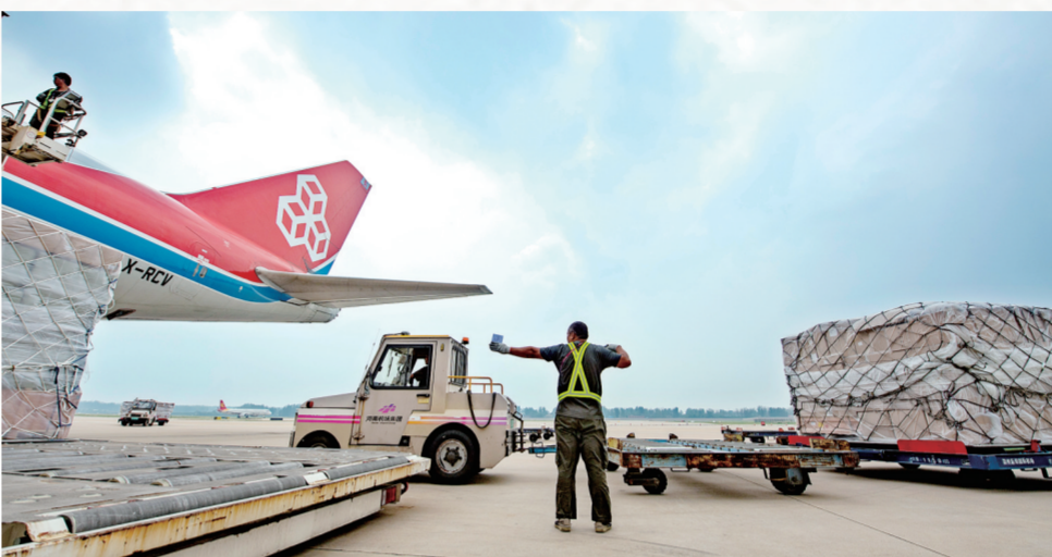
郑州—卢森堡国际货运航线

截至目前,在郑州机场运营的货运航空公司已达21家,开通货运航线34条,通航城市40个。在全球前20位货运枢纽机场中开通15个航点,基本形成了横跨欧美亚三大经济区、覆盖全球主要经济体的枢纽航线网络,成为引领中部、服务全国、辐射全球空中经济廊道。