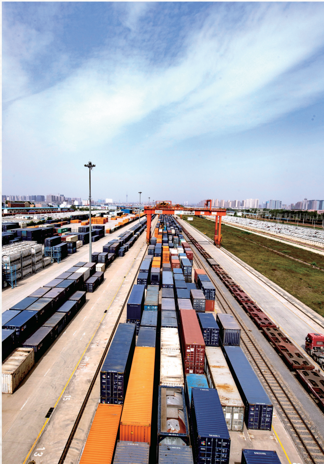
中欧班列(郑州)

作为“一带一路”重要节点城市,近几年,郑州空中、陆上、网上、海上“四条丝路”发展风生水起、如火如荼,推动郑州快速崛起为内陆开放新高地、加速融入“一带一路”建设。