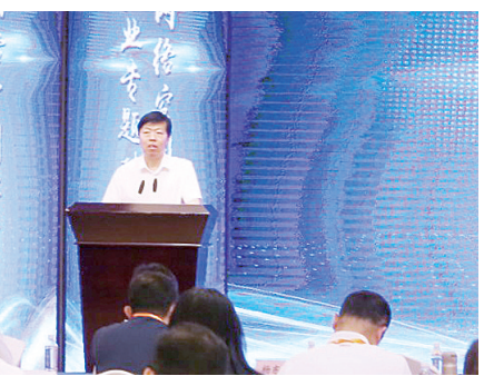
郑州市副市长史占勇