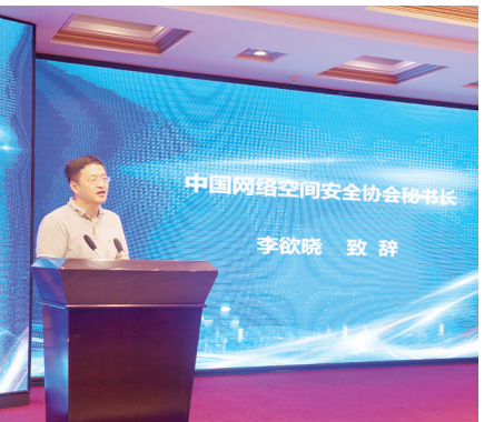
中国网络空间安全协会秘书长李欲晓