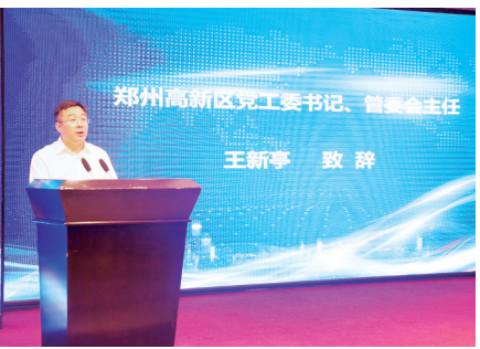
郑州高新区党工委书记、管委会主任王新亭