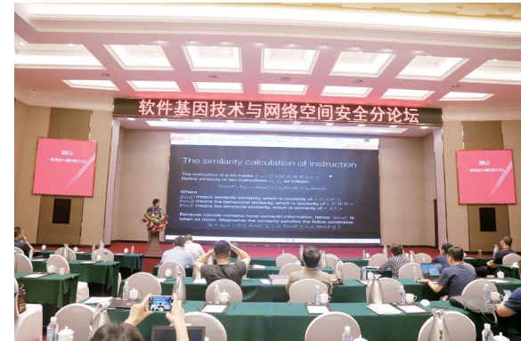
软件基因技术与网络空间安全分论坛