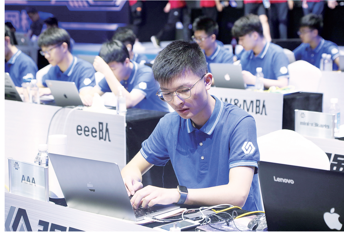
赛场上,选手们各显神通