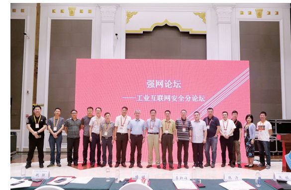
工业互联网安全分论坛