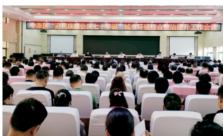
根据工作方案,这次城市环境综合整治分阶段推进实施。从7月1日至8月15

三个导向是问题导向、目标导向、责任导向。中原区将全面排查摸底,建立问题台账,细化任务分解、明确时间节点,跟踪督导,挂牌督办,把工作责任落实到具体事、具体人,每一项工作、每一项任务、每一项活动的内容、责任人要统一,谁来干、什么时间干、在什么地方干、干到什么标准,方案要全部细化,每一项活动直接到人、直接到事,减少层级,提高工作效率。